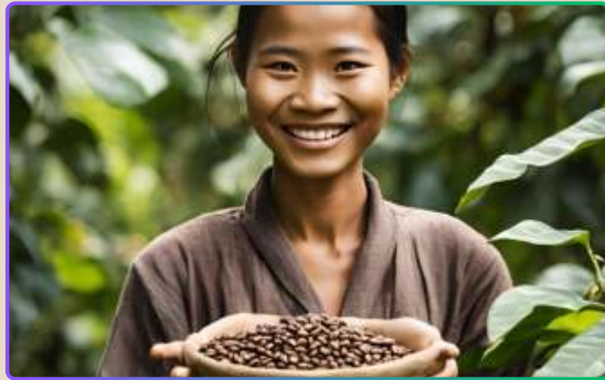
Ужин и шоу Апсара