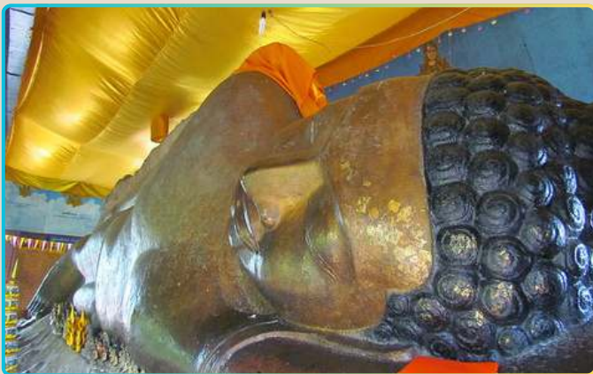
Храм Преа Анг Том