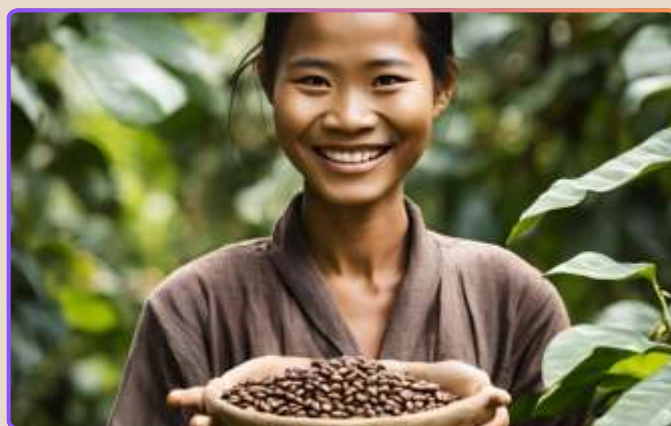
Ужин и шоу Апсара