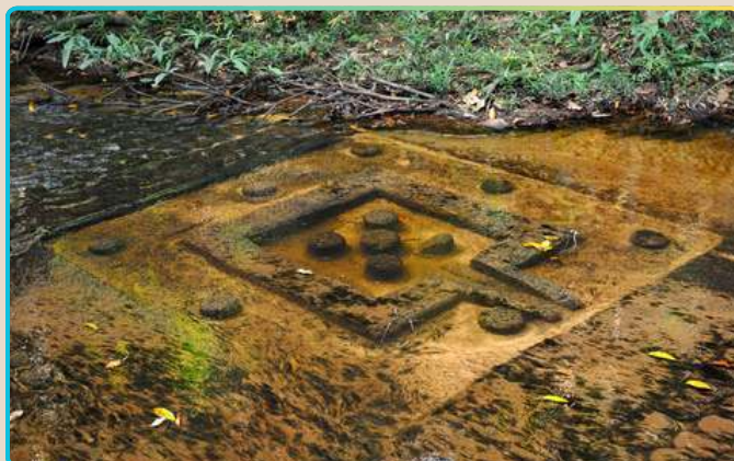
Священная река «1000 лингамов»