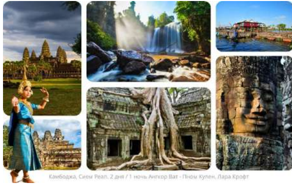
Камбоджа, Сиен Реап. 2 дня / 1 ночь Ангкор Ват - Пном Кулен. Лара Крофт