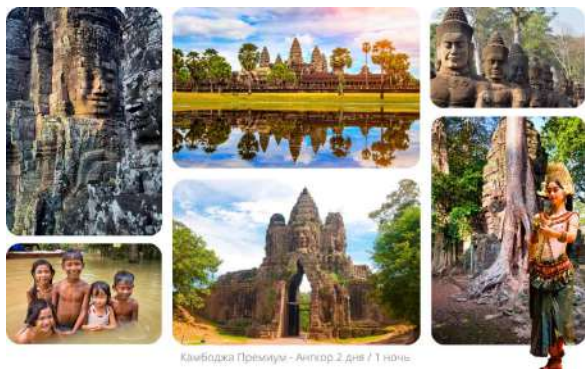
Камбоджа Премиум - Анкор 2 дня / 1 ночь