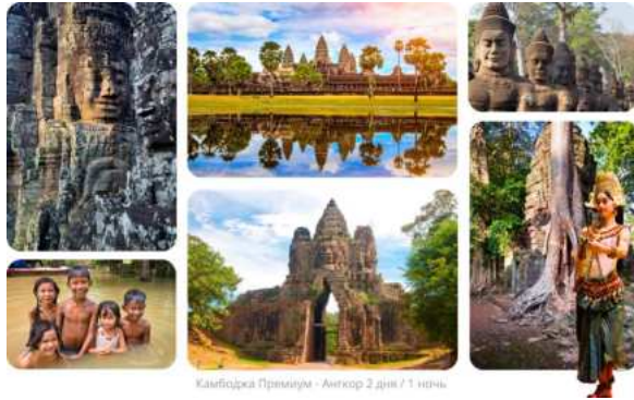
Камбоджа Премиум - Ангкор 2 дня / 1 ночь