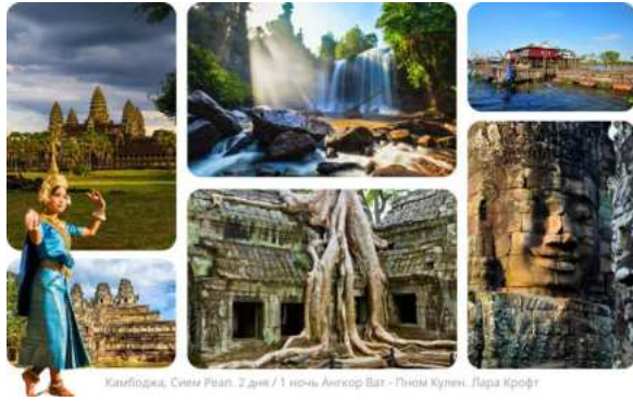
Камбоджа, Сиен Реап. 2 дня / 1 ночь Ангкор Ват - Пном Кулен. Лара Крофт