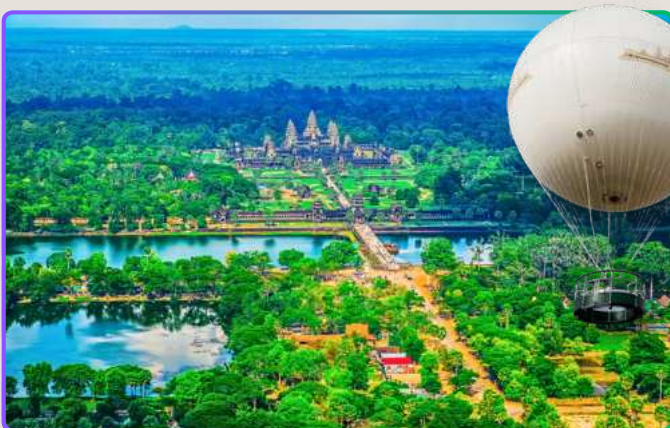
Полёт на воздушном шаре