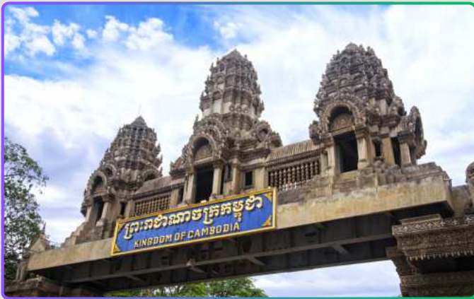
VIP проход границы