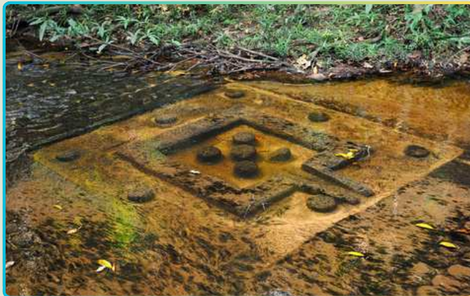
Священная река «1000 лингамов»