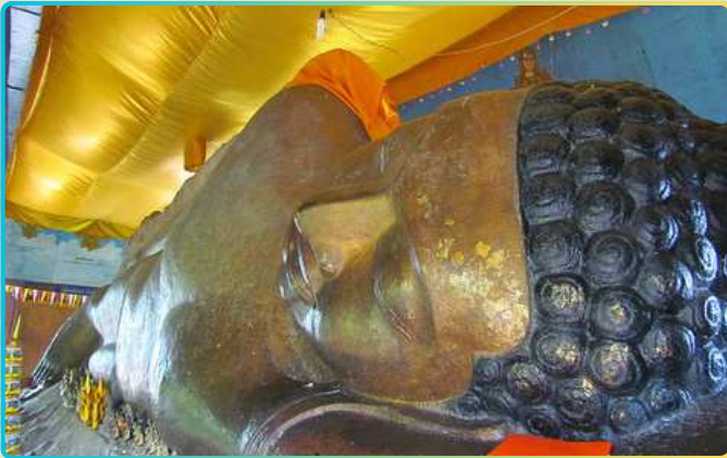
Храм Преа Анг Том