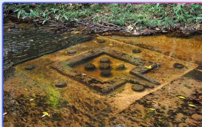
Священная река «1000 лингамов»