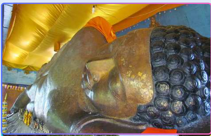
Храм Преа Анг Том